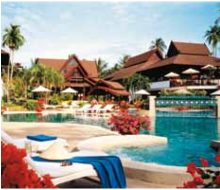
Amari Palm Reef Resort