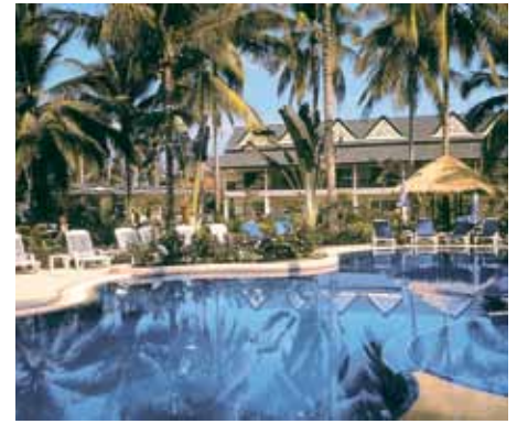
Paradise Beach Resort